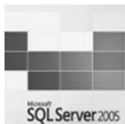
Figura 3 Microsoft SQL Server 2005

La razón fundamental por la cual se seleccionó este motor de base de datos así como el lenguaje de programación, es por que la facultad trabaja y tiene un convenio de licencia de la plataforma de desarrollo con Microsoft.