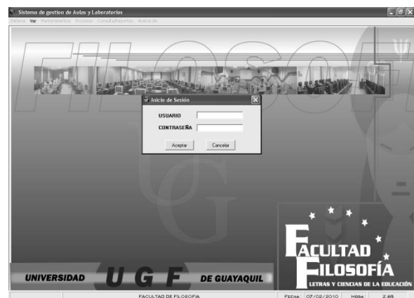
Figura 1 Pantalla principal del sistema